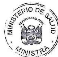
ROSA BERTHA GUTIÉRREZ PALOMINO Ministra de Salud